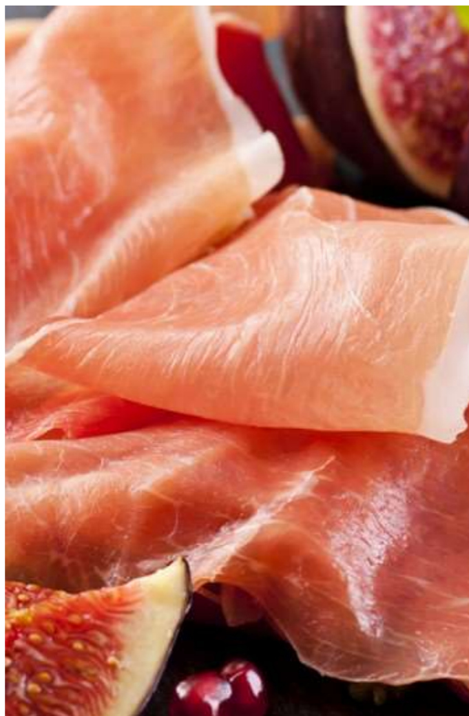
Prosciutto di Parma