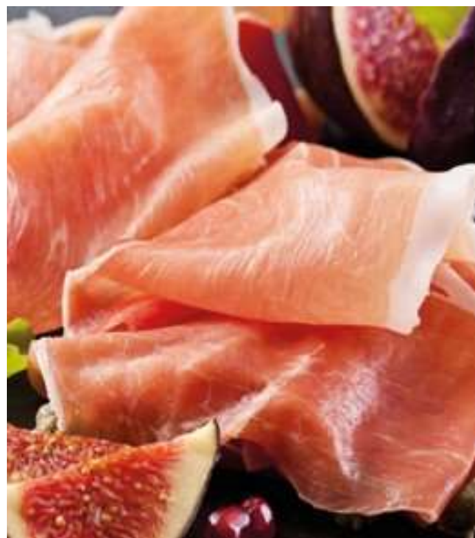
Prosciutto di Parma