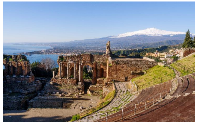
Teatro Griego de Taormina con Etna al fondo