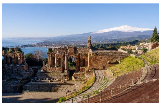
Teatro Griego de Taormina con Etna al fondo