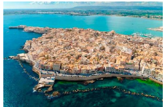
Península de Ortigia en Siracusa