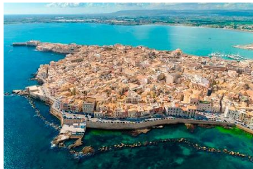
Península de Ortigia en Siracusa