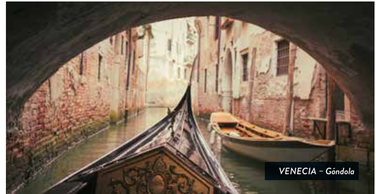
VENECIA – Góndola

Desayuno en el hotel y traslado a Venecia Isla, una ciudad mágica, única en su especie. Visita guiada por el centro histórico pasando por Piazza San Marco , el corazón de la ciudad, con sus extraordinarios edificios ( Basilica de San Marco , Palazzo Ducale , Torre dell'Orologio ) y por el Ponte dei Sospiri . Salida en barco a Murano para visitar una famosa cristalería y admirar el proceso de elaboración del vidrio.