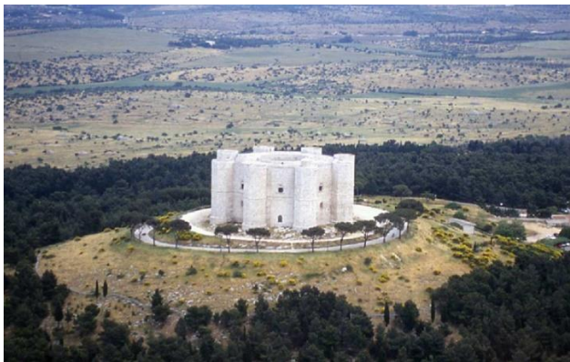
Castel del Monte

Desayuno. Salida para Matera con parada en el sensacional cerro donde surge el célebre Castel del Monte , edificación octagonal construida por el Rey de Sicilia Federico II en el siglo XIII y hoy representado en la moneda italiana de 2 centavos de Euro. Patrimonio mundial del UNESCO, el castillo fue una fortaleza, una cárcel e incluso una tumba. Visita y luego continuación para Matera . Almuerzo libre. La ciudad de los “Sassi” es también Patrimonio mundial del UNESCO por su barrio antiguo que es un ejemplo de urbanización prehistórica. Hoy las antiguas cuevas se han reutilizado por razones de vida diaria y turística y componen un paisaje realmente único que vale la pena de ser vivido. Visita y alojamiento en hotel.